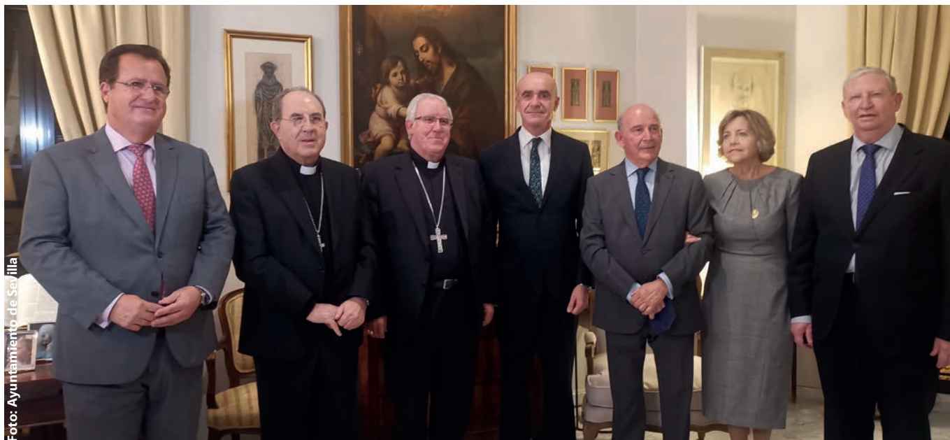
Visita de las autoridades eclesiásticas y civiles a la casa del pregonero de la Semana Santa, el pasado 24 de febrero.

ha volcado. Todo han sido saludos, enhorabuenas, felicidades, lisonjas, detalles... Y hay algunos absolutamente entrañables. Y las hermandades, que se vuelcan con el pregonero. Todos son atenciones, invitaciones. Cosa que dice mucho del ambiente de generosidad, de solidaridad y emoción que hay alrededor del pregón, por parte de toda la gente que es sensible a él.