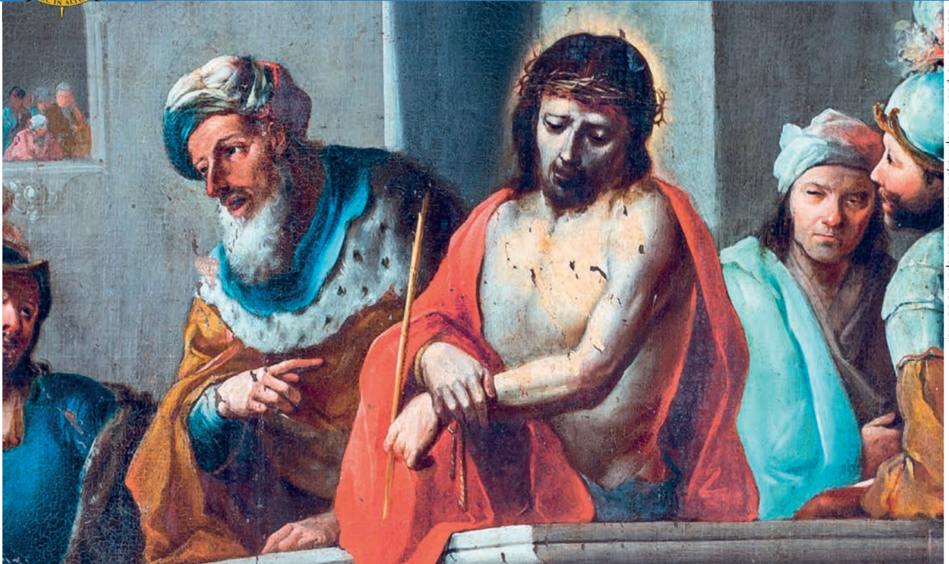
Ecce-Homo (Juan de Espinal). Palacio Arzobispal de Sevilla.