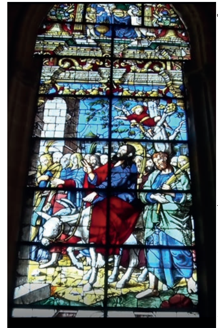
Sagrada entrada en Jerusalén; Arnao de Flandes, 1553. Capilla del Pilar (Catedral de Sevilla)

Se lo llevaron a Jesús y, después de poner sus mantos sobre el pollino, ayudaron a Jesús a montar sobre él. Mientras él iba avanzando, extendían sus mantos por el camino. Y, cuando se acercaba ya a la bajada del monte de los Olivos, la multitud de los discípulos, llenos de alegría, comenzaron a alabar a Dios a grandes voces por todos los milagros que habían visto, diciendo: «¡Bendito el rey que viene en nombre del Señor! Paz en el cielo y gloria en las alturas». Algunos fariseos de entre la gente le dijeron: «Maestro, reprende a tus discípulos». Y respondiendo, dijo: «Os digo que, si estos callan, gritarán las piedras».